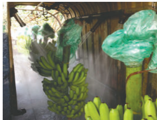
Foto: Control cultura de escama

Cultural: se recomienda realizar, podas, cirugías, aplicación de detergente y de agua a presión en la planta empacadora.