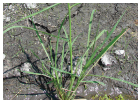
Etapa de floración