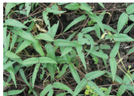
Etapla de floración