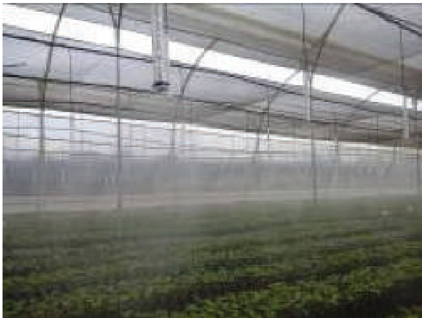
Sistema de riego por micro aspersion en vivero de café. EETP.

Los riegos en el vivero deben efectuarse periódicamente, según las necesidades hídricas de las plantitas, evitando la falta y los excesos de agua. A veces es necesario hasta un riego diario durante la época seca.