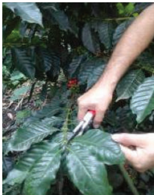
Toma de muestra foliar en cultivo de café.

El análisis foliar constituye una metodología sumamente eficiente para evaluar la nutrición del cultivo, especialmente en lo relacionado con la cantidad de micro elementos. Para el efecto, se muestrean de 50 a 60 pares de hojas, recolectando al azar, en varios puntos del cafetal, en al menos 40 cafetos / hectárea, las hojas debe estar en pleno desarrollo, ubicando a las que están en el cuarto par, contadas a partir de la punta de las ramas ubicadas en el tercio superior de la planta, se debe evitar tomar hojas en mal estado, con daños mecánicos, afectadas por plagas o enfermedades, residuos de polvo, agroquímicos, etc. Las hojas son empacadas en fundas de papel (no plástico) y entregadas en laboratorio máximo 24 horas después de su recolección.