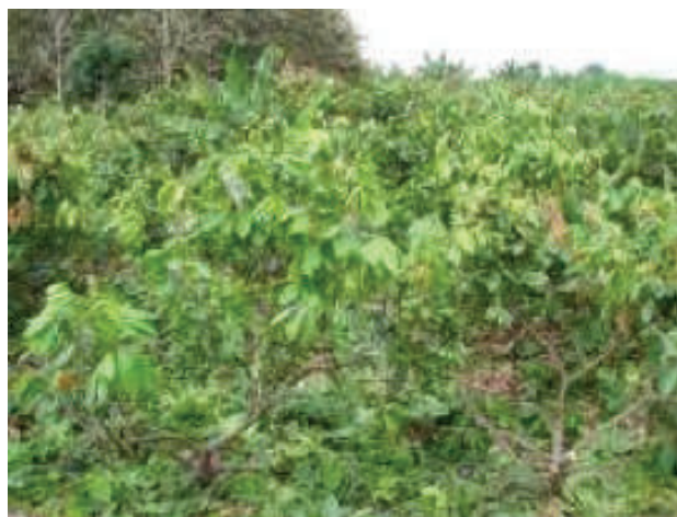
Cultivo de cacao podado