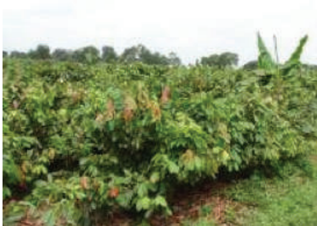
Cultivo de cacao sin podar

Tiene como objetivo mantener la forma de árbol, promover el ingreso de suficiente luz y aireación a todo el follaje de las plantas. Se recomienda realizarla en época seca, eliminar chupones innecesarios, entresacar ramas mal formadas, improductivas o secas, retirar las plantas parásitas de ramas y tallos. Esta clase de podas debe ser ligera (30 % de follaje).