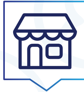
PYMES (Pequeñas y Medianas Empresas)